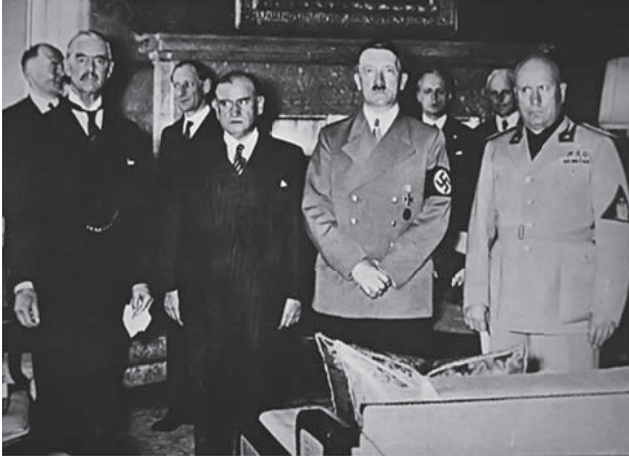
هتلر مع شامبرلين ودلاديه وموسوليني.

قال لهم البسوا الكساوى والشارات التي تحبونها، واخرجوا في الشوارع صفوفًا صفوفًا تزعمون وتتوعدون، واضربوا اليهود واضربوا الشيوعيين واضربوا الديمقراطيين واضربوا النازيين المخالفين ... اضربوا اضربوا ولكم المجد والفخر وعلى فرائسكم المسبة والعار.