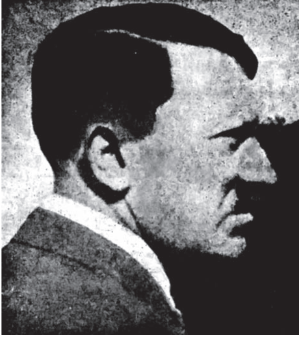
هتلر في نوبة سوداء.