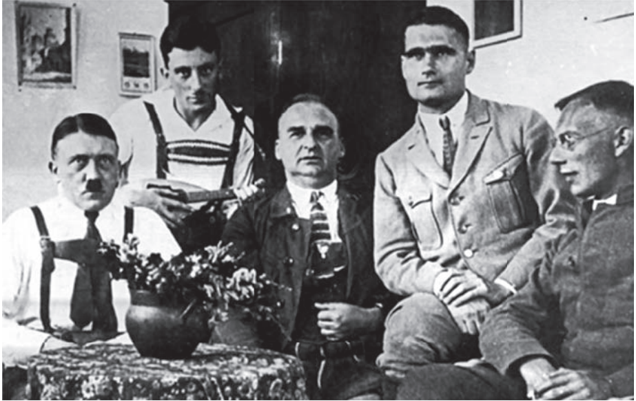
هتلر وزملاؤه في السجن (تلاحظ هدية الزهر التي كانت أمامه).

ولما تبين أن «الجنسية الألمانية» لا تشملها لأنه رعية الحكومة النمساوية، احتالت وزارة برنسويك على الأمر بتعيينه في وظيفة «شرفية» تسمى وظيفة الاستشارة في تلك الحكومة Regierungsrat ليصبح ألماني الجنس بحكم التوظيف؛ وفقاً لدستور فيمار الذي يشمل الجنسية الألمانية كل أجنبي يشغل وظيفة في حكومات الولايات، أو حكومة الريخ الكبرى.