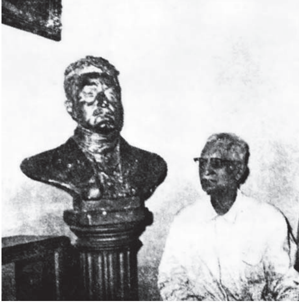
العقاد يستمع إلى المذيع في حجرة الصالون.

إنني لا أسأل عن أولئك القراء والدارسين الذين ألفوا عشرات الكتب بالليل والنهار، إن هؤلاء ينظرون إلى كتبهم كما ينظر الجوهري إلى الثروات المخزونة عنده في صناديق البلور من نواذر الفصوص والأحجار الكريمة، أو كما ينظر البستاني إلى أحواض الزهر، وهي تتعرع أو تدبل بين يديه، أو كما ينظر صاحب القصر إلى أسراب الحسان المقصورات فيه، أو كما ينظر المهندس إلى الأزرار التي في لوحته وقد ينطلق كل زر منها بما يحرك مدينة بأسرها، وكلهم يملكون زمامهم، أو زمام تلك المرثيات وهم يحسون بها، وكلهم يحضرون منها ما ألفوه وتعودوه وكرروه، وقد يغيب عنهم منها جانب المفاجأة والغرابة، ولكنني أحب من حين إلى حين أن أستغرب ما ألف وأن ألف ما أستغرب، ويثير هذا الشوق في خاطري أن أشهد وقع هذه الغرابة مرتجلاً في بعض النفوس، ولا سيما النفوس التي تقارب الكتب من بعيد.