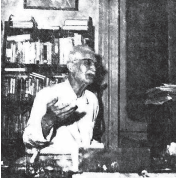
في حجرة المكتب وفي حديث خاطف مع أحد زائريه.

وقد استقبلت فيه آمالاً، واستحييت فيه ذكريات، ومن غار على ذخيرة أماله وبواطن ذكرياته، فقد يغار على مواطنها أن تستباح بعده لكل من يشاء. تلك يا صاحبي سياحتي التي أردتها في بيتي، وأردت أن تحيط بما يحوطني فيها من شاغل أو عمل أو مقال، أطلعتك منها على ما يعني الناس، وتتصل فيه حياة الكاتب بين العالم والدار، فأما الذي يعنيني ولا يعني أحداً غيري فلأن أقول أنا إنه لا يعينهم خير من أن يقرأه قارئٌ فيسأل قارئاً آخر: وما الذي يعيننا نحن من هذا المقال؟ ثم يتفقدان على الجواب!