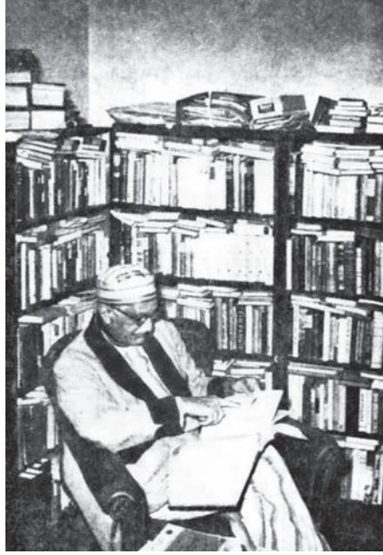
« في حجرة المكتبة » العقاد في جلسة أمام قسم الأدب الإنجليزي في بيته.