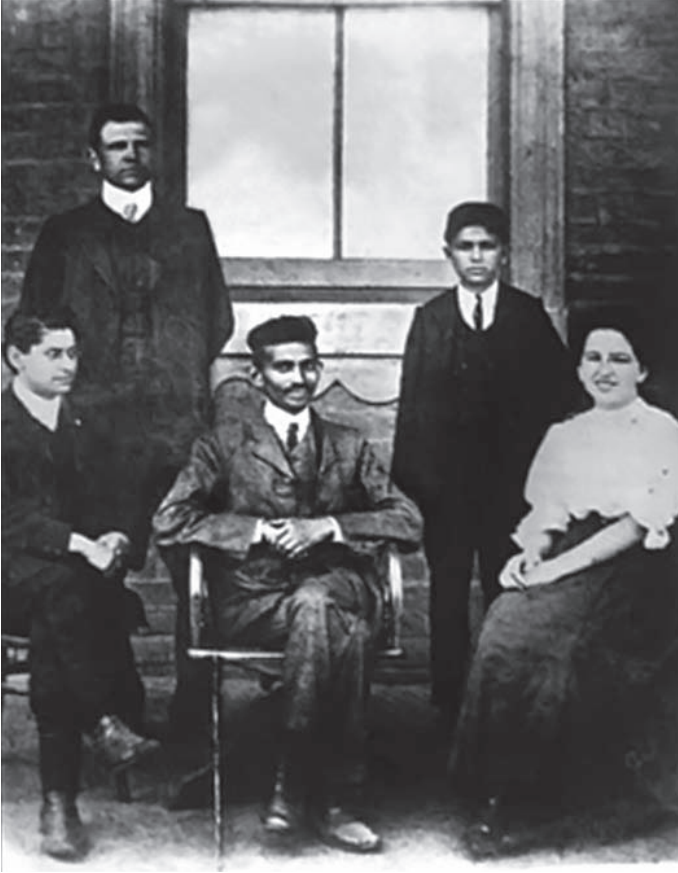
غاندي في أفريقية الجنوبية.

القوانين التي تحجر على حرية العمال الملونين في الإقامة، أو تقتصر عليهم في الأجور، أو تسومهم الطاعة لما لا يطاق من الغبن والإجحاف.