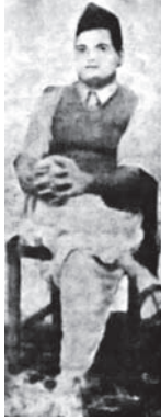
«جودس» قاتل غاندي.

وما نظن أن قاتلاً ضريت نفسه بالشر كما ضريت نفس هذا التعس المفتون، فحسبك نية القتل إذا كان القتل هو غاندي، تلك وحدها كافية.