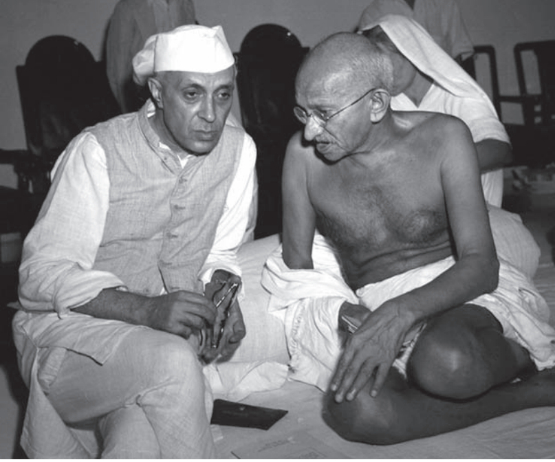
نهر ريس الحكومة الهندية يصغي إلى غاندي.

فليكن إخاء بين أحرار، وليدخل في زمرة المهزومين في ميادين القتال، ولا يعامل أحد من هؤلاء المهزومين معاملة التشفي والانتقام.