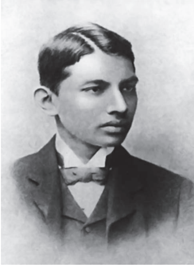
غاندي في الجامعة.

كان بعض الهنود ينقادون لغاندي في حملات المقاومة السلبية؛ لأنهم يؤمنون مثله باجتئاب العنف والتورع من إزهاق كل حياة. لكن عمال الجنوب فيهم صينيون وأندونسيون، وفيهم هنود غير مؤمنين بالنحلة التي يؤمن بها الزعيم، وفيهم زنوج ووثنيون لا يعرفون من الأديان غير أديان الهمجية الأولى.