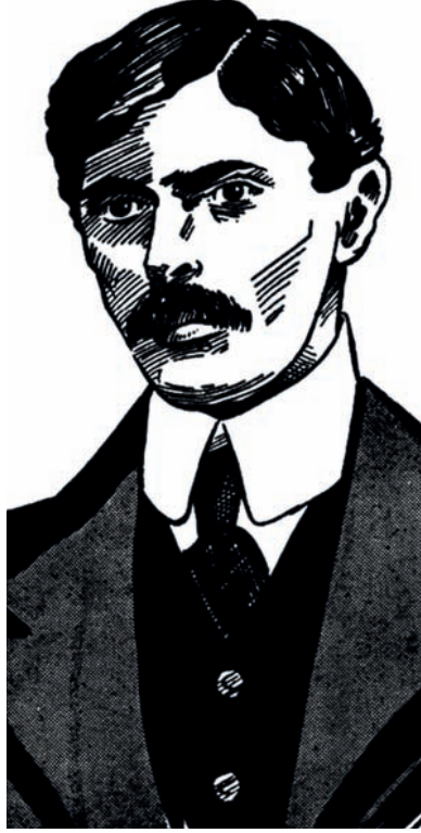
محمد علي جناح في شبابه.

على أن موضوعاته التي أولع بها في إنجلترا قد تنبئ عن الموضوعات التي كان يجنح إليها بتفكيره وميول نفسه منذ طفولته الأولى، وأوفر هذه الموضوعات نصيباً من إقباله وعنايته دروس القانون والأدب، ومراجع التاريخ من ناحيته السياسية على الخصوص. كان يتعلم القانون رغبة واستعداداً لا لمجرد التوسل به إلى مناصب القضاء والإدارة، وكان ذهنه من أذهان الفقه والحاماة والفصاحة الخطابية طبعاً وفطرة لا تعلماً ومراساً بالصناعة.