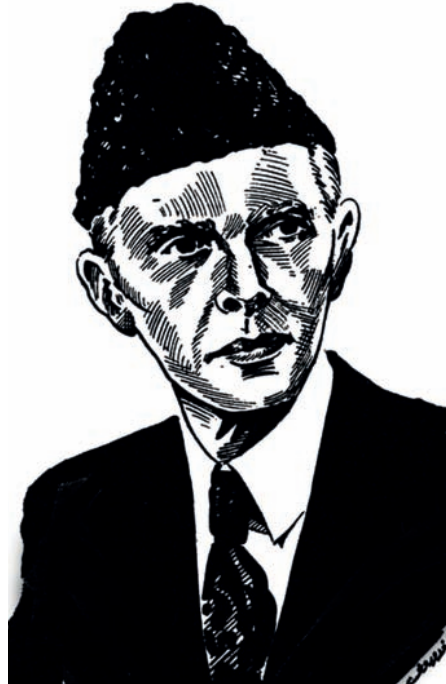
محمد علي جناح.